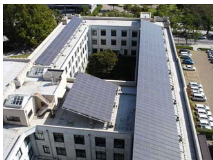
佐賀県太陽光発電トップランナー推進事業(佐賀県)