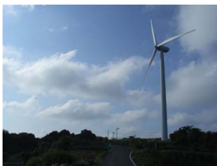
唐津市肥前町納所地区風力発電導入事業(唐津市)