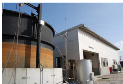
バイオマスエネルギーの複合利活用と地域環境保全の取り組み(有限会社鳥栖環境開発総合センター)

主催:佐賀県、唐津市、(有)鳥栖環境開発総合センター、九州経済産業局、NEDO九州支部